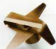
Emulgiermesser 4 Klingen

Unentbehrlich und sicher: Die Wandhalterung für Gerät, Stab oder Rührbesen (inklusive).